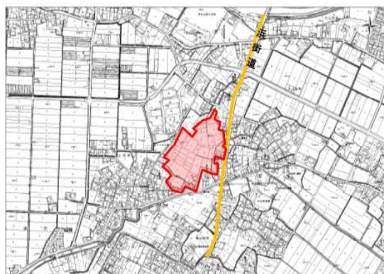
位置図（草津市北山田町五条、山田町の一部）

『北山田五条・山田地区計画』（約3.8ha）をプランの中核事業に位置付け、山田まちづくりセンターの更新（地積約1,700㎡）と商業施設の誘致を進める生活拠点づくりの取組みを進めてきました。